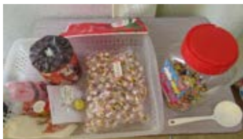
マツダ労働組合様クリスマスプレゼント