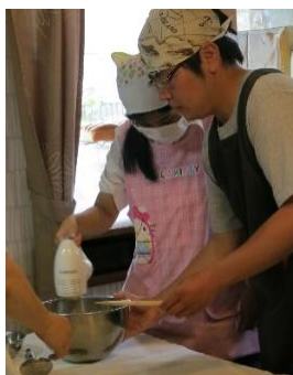
男子と女子で頑張ります！