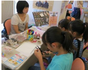
マスキングテープで絆創膏を青作ったり、プラ板でキーホルダーを作りました。

9/30(土) 10/1(日) ルルサスでセンターの紹介と虹とおひさまの商品を紹介してきました。ドネーション(寄付9,000円)をいただきました。応援してくださった皆様、ありがとうございました。