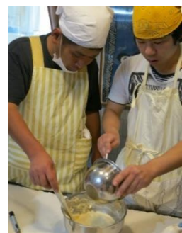
男子2人で頑張ります！