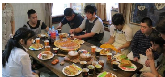
♪ハッピーバースデー トゥーユー♪を歌い、美味しくいただきました