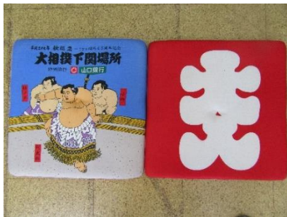
座布団 藤井 千江 様