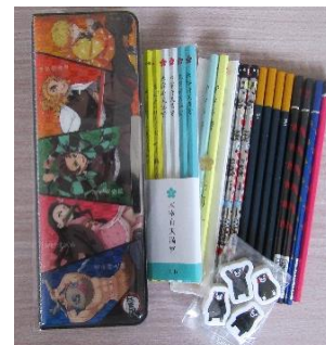
筆箱・鉛筆・消しゴム 重長 勇作 様