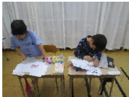
5年生（キッズ2名）ピクトグラムを作成中