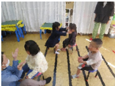
なかよしキッズ（4名）イスとりゲームの様子

なかよしキッズは、ダウン症児のみのクラスであり、1歳前から個別で通われている子どもたちもいます。個別で培われた力を小集団の中で般化して欲しい気持ちから、昨年2月に立ち上げました。「メインの指導者に注意を向けること」「プリント学習」「ルール性のある遊び」「指先の巧緻性を高める内容」をベースにしながら、行って1年。友だちを助ける、手伝う等の予想していなかった行動も見られるようになってきました。5年生キッズは、小1から継続してきた仲間であり、それぞれの得意不得意もわかり合った仲であり、程よい距離を取りながら、活動を楽しんでいます。