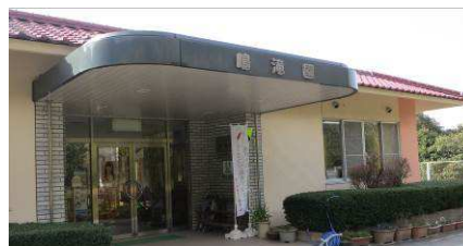
↑障がいがある我が子を思い、設立された鳴滝園

3月6日（金）職員研修で山口市下小鯖にある社会福祉法人 ほおの木会「鳴滝園」に行きました。鳴滝園は心身に障がいを持っている人たちが自宅やグループホームから通いながら自分の能力にあった仕事を毎日頑張っている社会福祉事業所です。その事業活動（仕事）のひとつとして、ケーキ・クッキー・パンなどの製造販売をしています。下小鯖にあるスワンベーカーもその1つです。是非「鳴滝園」を検索してみてください。楽しそうな鳴滝園が伝わってきます。