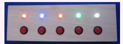
パチパチスイッチ

子どもたちから教えていただきながら、さらに私たち大人は豊かになっていくのですね。コロナ禍で、そのことばかりが話題になりがちですが、日常の中での大きな発見に目を向け続けていきたいと思っています。